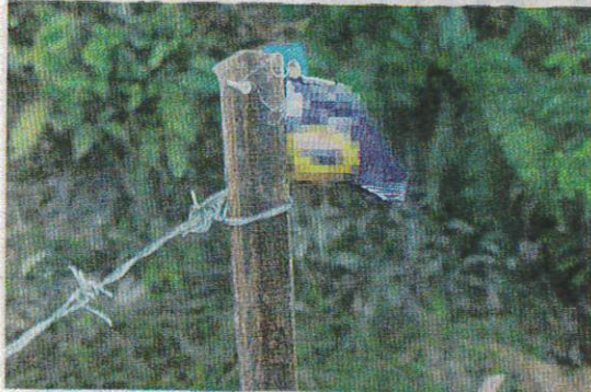
KEROPOK mengandungi racun tikus yang dimakan dua beradik dalam kejadian di Kampung Padang Ubi, Labu Besar di Kulim, Kedah.