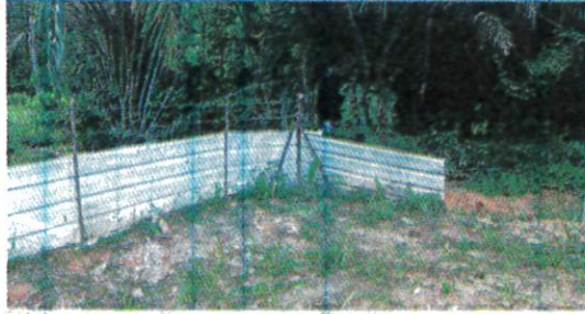
Di pagar inilah makanan ringan yang dicampur racun digantung bagi tujuan untuk memerangkap monyet.

"Hasil pemeriksaan pegawai perubatan Hospital Kulim mendapati kedua-dua mangsa berada dalam keadaan kritikal dan