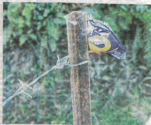
Keropok yang mengandungi racun tikus yang digantung pada dawai besi oleh pekebun untuk memerangkap monyet.

Mohd Azizul memberitahu, siasatan lanjut masih diteruskan mengikut Seksyen 31 (1) (a) Akta 611 dan Seksyen Sek 284 Kanun Keseksaan.