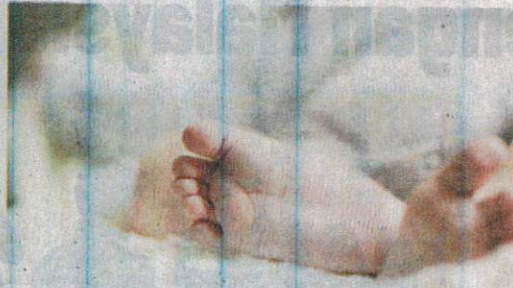
Insiden melibatkan bayi satu bulan yang dipercayai berlaku pada bulan lalu itu tular di Telegram. - Gambar hiasan

"Sekitar 10 malam, jururawat mula memasukkan air drip kerana perlu berpuasa dalam keadaan anak dibedung," tulisnya lagi.