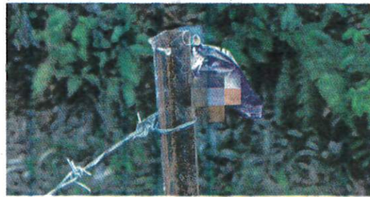
KEROPOK yang dicampur racun dan diletakkan dipagar dipercayai untuk memerangkap monyet.

Katanya, dia dimaklumkan menantunya, Nurain bahawa cucu berusia dua tahun ditemui menggelupur seperti diserang sawan dengan mulut berbuih di